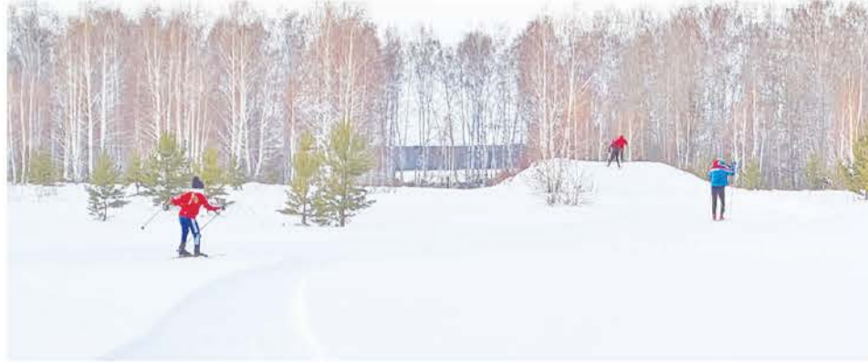
На лыжной базе еженедельно организуются различные спортивные мероприятия.

им школе, его уроки помнят несколько поколений байкаловцев.