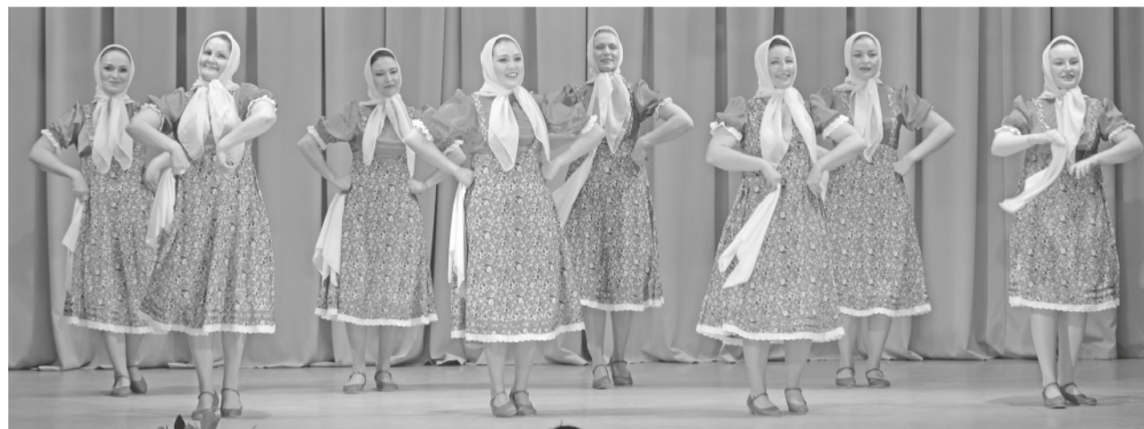
Артисты пели, танцевали, наполняли атмосферу зрительного зала улыбками.