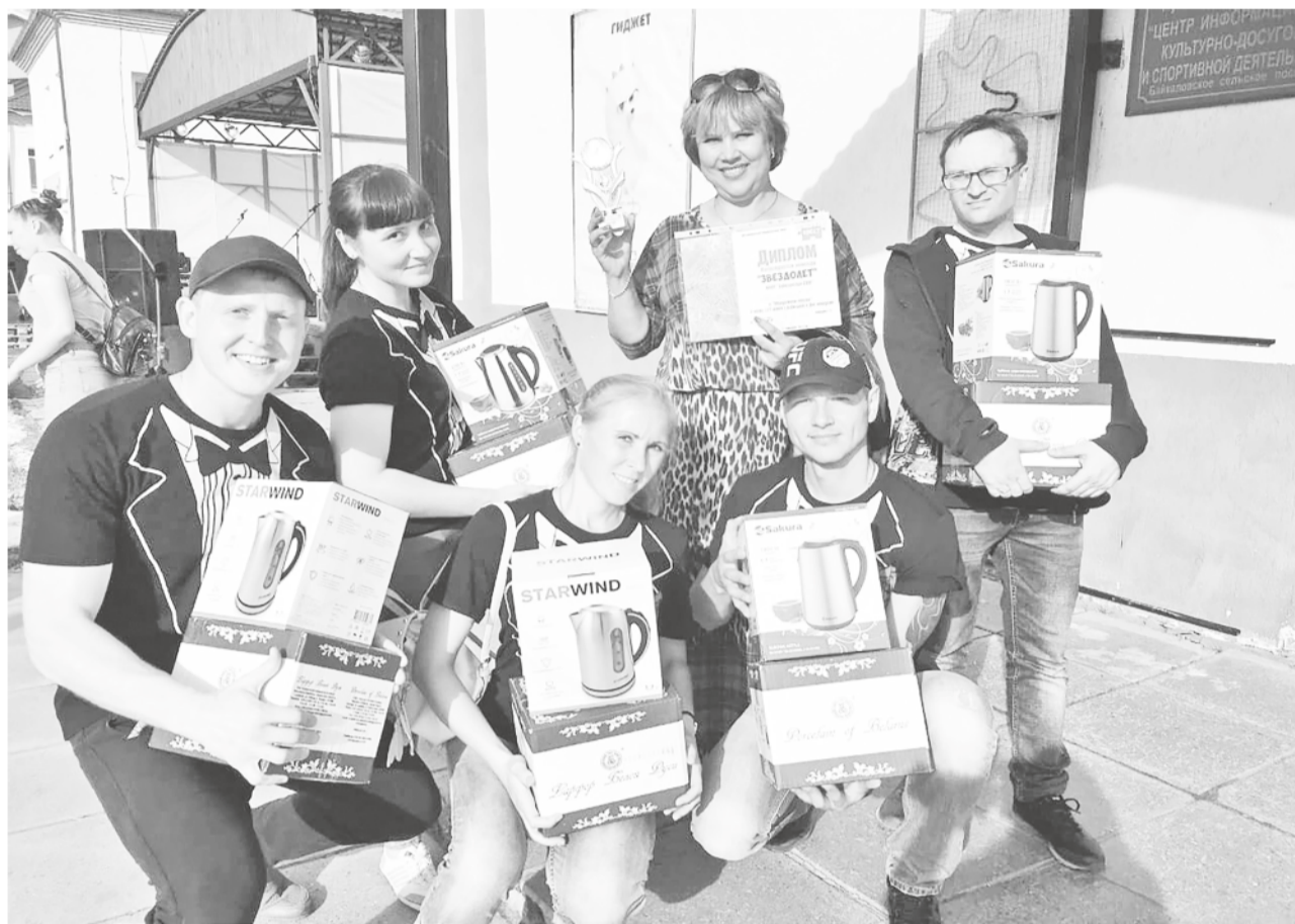
Участники квеста, посвящённого Дню Байкалово в 2019 году. Члены профсоюза команды «Звездолёт» стали победителями и получили ценные призы.