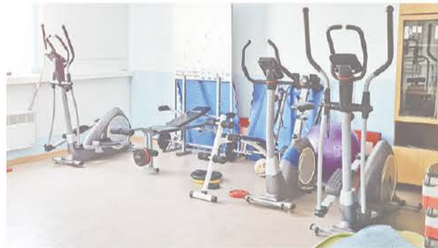
На базе имеется фитнес-зал...