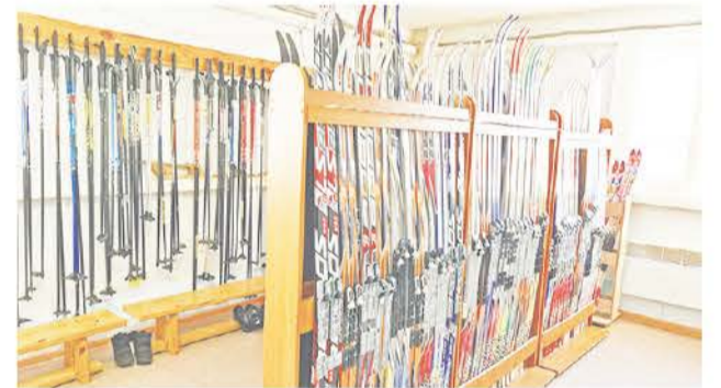
... а также прокат лыж и спортивного инвентаря.